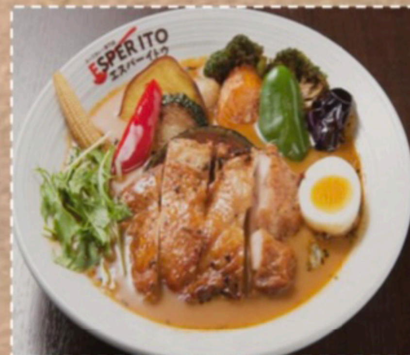
〈エスパーチキンベジタブル〉 当店の看板メニュー！ 12品目の彩り野菜と 選べる3種のチキンカレー