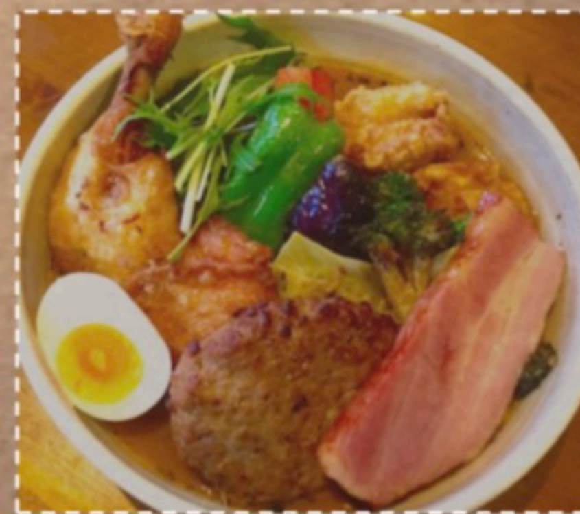
〈エスパースペシャルカレー〉 とりあえずいろいろ食べたい！ そんなお客様にピッタリな 全乗せスペシャルカレー