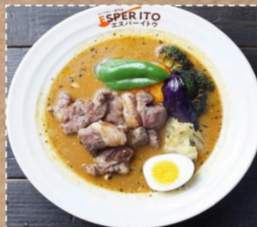
〈エスパーラムちゃん〉 スパイスをまぶしたラムステーキは スープカレーと相性抜群！ 店長オススメ！